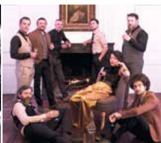
Cut the Alligator Funky/Groovy