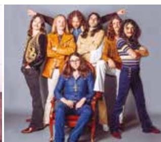
Komodrag and the Mounodor Soul / Pop