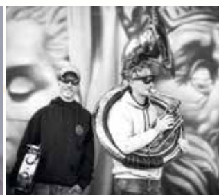
Tekemat Rock - Heavy - Psyche