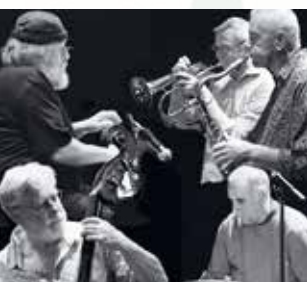
Les amateurs Jazz