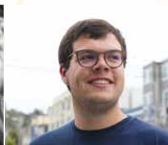
Tomy Cheese Electro