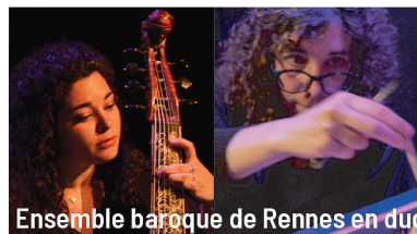
Ensemble baroque de Rennes en duo

Tarifs : Adulte 13 euros - Pass 4 concerts 40 euros Gratuit pour les -18 ans