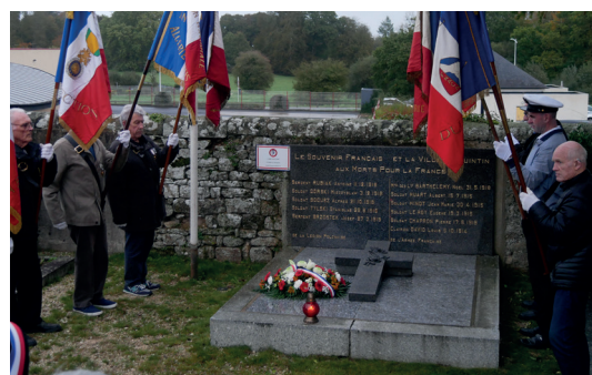
Cérémonie du 31 octobre 2023 au carré militaire du cimetière